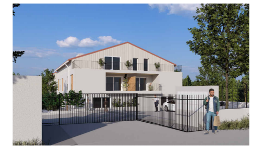
MEYREUIL Construction de 22 logements 257, Chemin des Pérussiers, 13590 Meyreuil